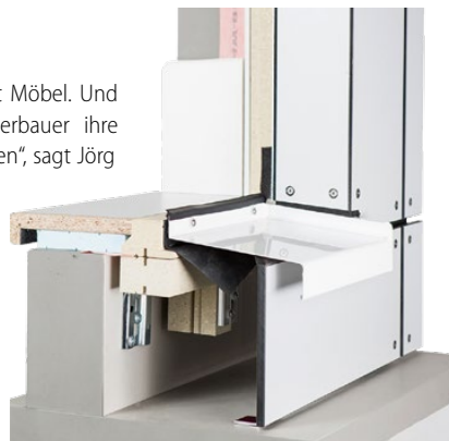
Nach Abschluss der Bauphase verschwindet die Zarge unauffällig im Mauerwerk.

Fenster sind heute in gewisser Hinsicht Möbel. Und „mit unserem System könnten Fensterbauer ihre Fenster auch erst bei Lieferung der Möbel montieren“, sagt Jörg Stahlmann. Das Prinzip dahinter ist eine Montagezarge, die für mehr Ausführungssicherheit, Effizienz und nachhaltige Wirtschaftlichkeit sorgt. Montagezargen, oder auch „Blindstöcke“ genannt, werden anstelle des eigentlichen Bauelementes eingebaut und es wird die gleiche Sorgfalt und Ausführung wie bei den eigentlichen Fenstern – und Türen im Außenbereich – angewandt.